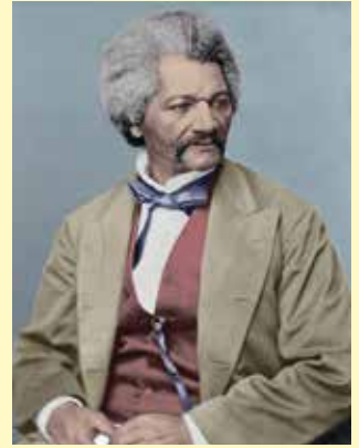
Frederick Douglass, iarsclábhaí agus ceannaire ar an ngluaiseacht frithsclábhaíochta. Thug Ó Conaill cuireadh dó óráid a thabhairt i mBaile Átha Cliath.

Giúdach/Giúdaigh: Jew(s) Acht um Chealú na Sclábhaíochta: Slavery Abolition Act gluaiseacht frithsclábhaíochta: anti-slavery movement an Chéad Chomhdháil Frith- Sclábhaíochta: the first Anti- Slavery Convention cáin (ag cáineadh, ainm briathartha): criticising dochrach, díobhálach: harmful athbhunú: re-establishment