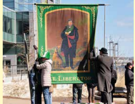
Ag ceiliúradh Lá 'le Pádraig in Halifax, Ceanada, le hómhá den Fhuascailteoir. Mí an Mhárta 2023.

for a moment changed his end and never hesitated to change his means.' Cumadh na céadta amhrán agus dánta faoi i nGaeilge agus i mBéarla. Chruthaigh sé múnla don traidisiún parlaiminteach a d'fhéadfadh ceannairí eile a leanúint in Éirinn agus thar lear.