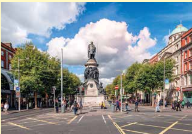
Dealbh de Dhónall Ó Conaill ar Shráid Uí Chonaill, Baile Átha Cliath.