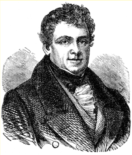
Dónall Ó Conaill