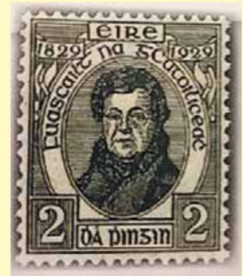
Stampa ag comóradh éachtaí a rinne Dónall Ó Conaill.

talamh a raibh luach áirithe ard air: land which had a certain high value