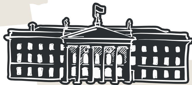
Ard-Oifig an Phoist (GPO), Baile Átha Cliath